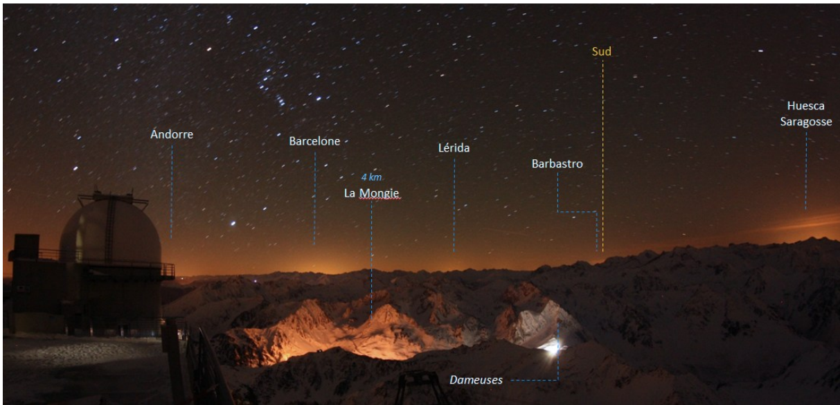
Illustration 2: Ciel et horizon depuis l'Observatoire du Pic du Midi (Pyrénées).