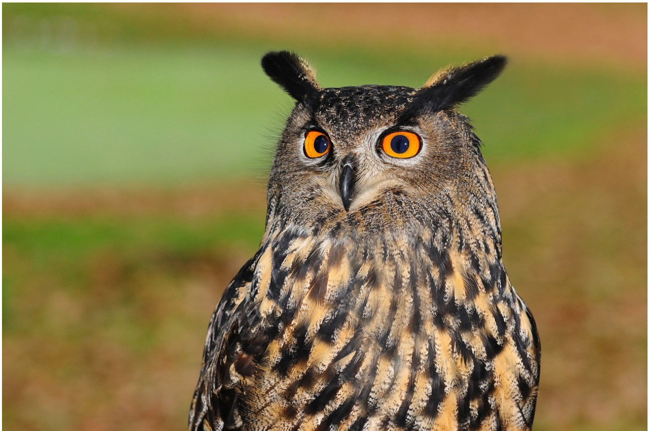
Le hibou Grand-duc par ses grands yeux

Exemples d'animaux nocturnes ayant développés des capacités pour vivre la nuit :