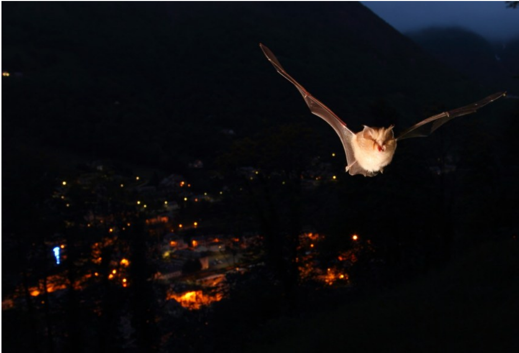
Le petit rhinolophe par ses grandes oreilles