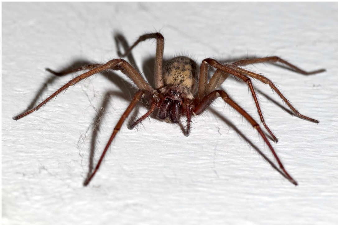
L'araignée par ses poils sensoriels