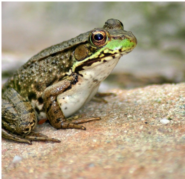
La grenouille verte