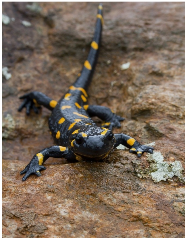
La salamandre tachetée