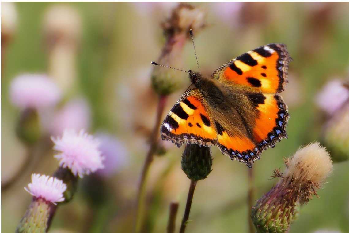
La petite tortue (papillon de jour)