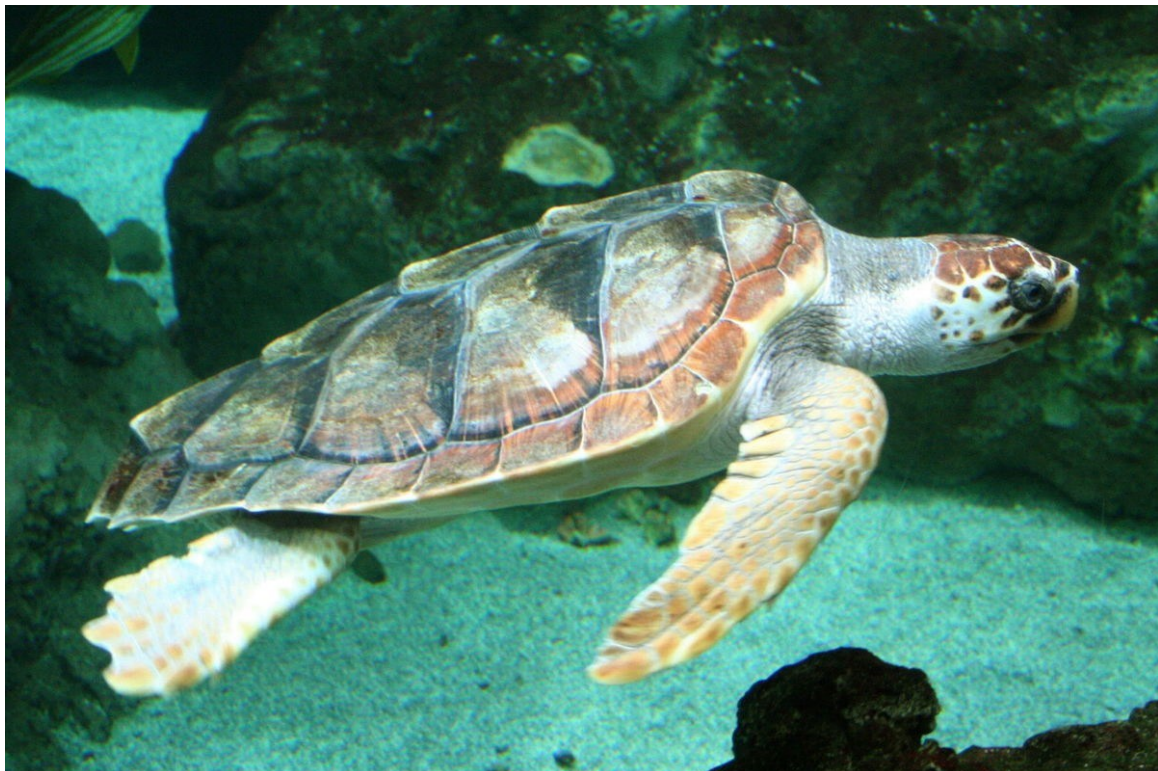
La tortue caouanne