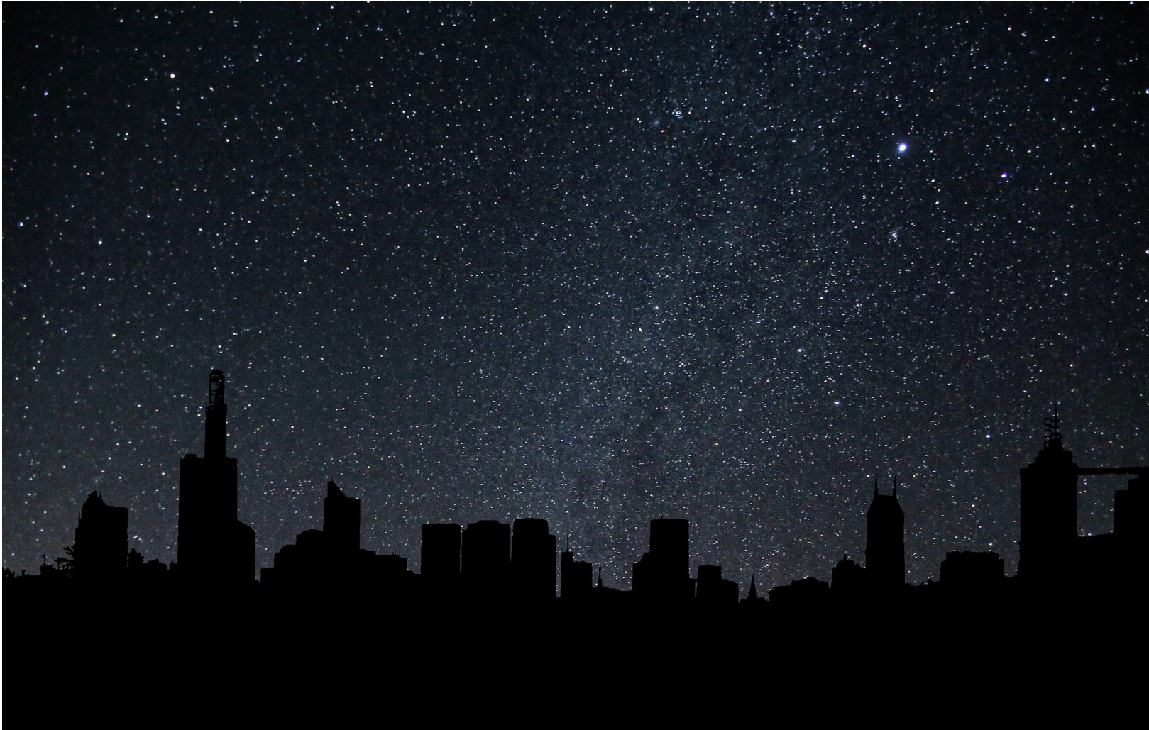
Silhouette de ville éteinte